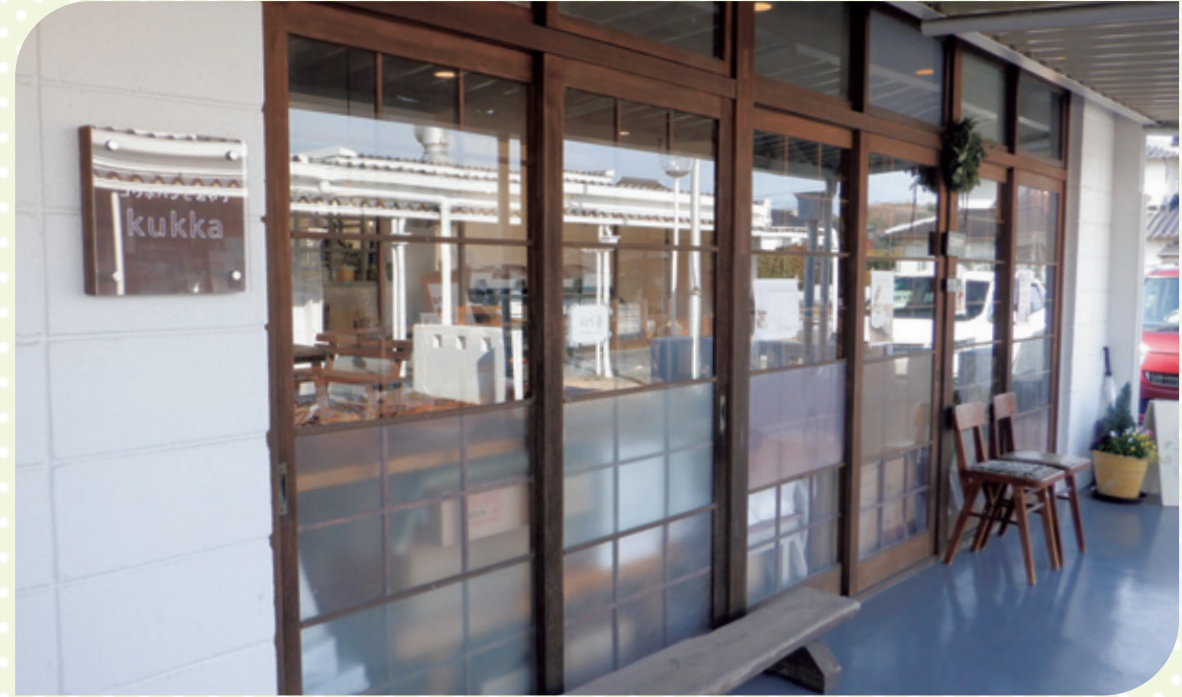
▲幼稚園の雰囲気を残しながら、おしゃれにリノベーションしています