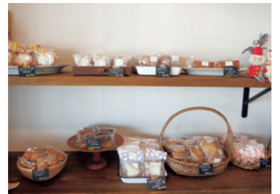
▲ベーグルやクロワッサンなど、様々な種類のパンを販売季節に合わせたケーキも人気です

コウボパンとおやつ kukka 住所 津山市林田767-1 営業時間 午前10時30分～午後4時30分 定休日 日曜日・月曜日・火曜日 (不定休あり) Instagram @kukka0306