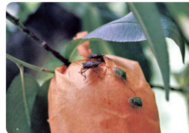
(写真1) 果実袋の上からモモを加害する果樹カメムシ類

多発年か否かの情報はとても大切です。詳しい説明は割愛しますが、春先にスギやヒノキの花粉飛散数が極端に多く、かつ暖冬だと翌年の被害が多発します。さらに、その年のスギやヒノキの花粉飛散数が極端に少ないと、成熟期の被害がさらに助長されます。今年の果樹カメムシ類の発生量は、病害虫防除所が発表する5～7月の発生予察情報をご参照ください。