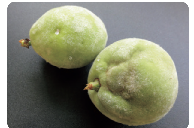
(写真2) モモ幼果の被害