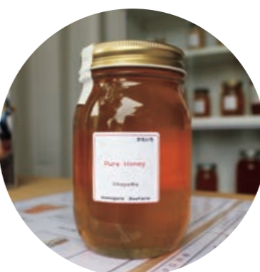
▲「かもいち」は「かもがた養蜂でいちばんのおすすめ」の略

で正統派な味わい。スタンダードなはちみつをお求めの方には百花はちみつ、花ごとの特徴を感じたい方は単花はちみつもおすすめです。 オンラインでの販売もありますが、「かもいち」は実店舗のみでの販売となっています。ぜひ、かもがた養蜂のはちみつを食べて自分好みのはちみつを探してみてください。