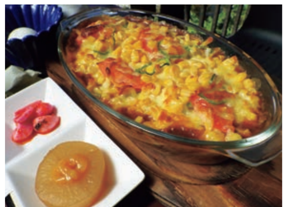
▲ボリューム満点の焼きカレー

気さくで明るいうご夫婦が経営する「カフェYUME工房」は、真庭市美甘地域の空き家になっていた古民家を改装し、今年6月にオープンしました。お店ではコーヒーや定食だけでなく、夜限定の居酒屋メニューも提供。お酒も楽しむことができます。