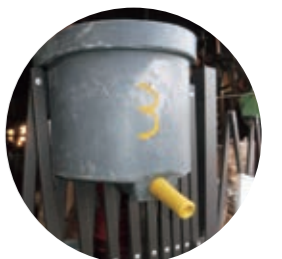
ちびちび哺乳に適した 哺乳器具 (サージミヤワキ・ミルクパー)