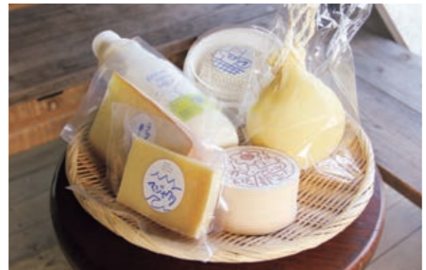
▲売り切れ必至の絶品手作りチーズはお酒のお供にもぴったり いつものお酒がさらにおいしくなります

吉備中央町の吉田牧場では自家生産した牛乳を使った手作りのチーズを販売しています。 店舗近くの放牧場では、日本では珍しいブラウンスイス種の乳牛が放牧されている姿を見学することができます。(観光農園ではないので、見学できない時もあります。) 長年の研究により完成したチーズの味は、全国の有名シェフやレストランから高く評価されています。引き合いは絶えませんが、手作りにこだわり少量生産のため、売り切れることもございます。