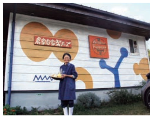
▲かわいらしいペイントの建物が目印 店舗では奥様や娘さんたちが対応してくれます

吉備中央町の吉田牧場では自家生産した牛乳を使った手作りのチーズを販売しています。 店舗近くの放牧場では、日本では珍しいブラウンスイス種の乳牛が放牧されている姿を見学することができます。(観光農園ではないので、見学できない時もあります。) 長年の研究により完成したチーズの味は、全国の有名シェフやレストランから高く評価されています。引き合いは絶えませんが、手作りにこだわり少量生産のため、売り切れることもございます。