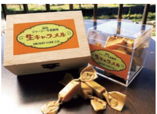
▲大量生産ができないため、お求めの際には事前の電話確認をおすすめします

かもがた養蜂 住所 浅口市鴨方町小坂東3044-1 電話 0865-430139 営業日 金曜日・土曜日・日曜日・月曜日 営業時間 午前10時～午後4時 ※自動販売機は年中無休(24時間稼働)